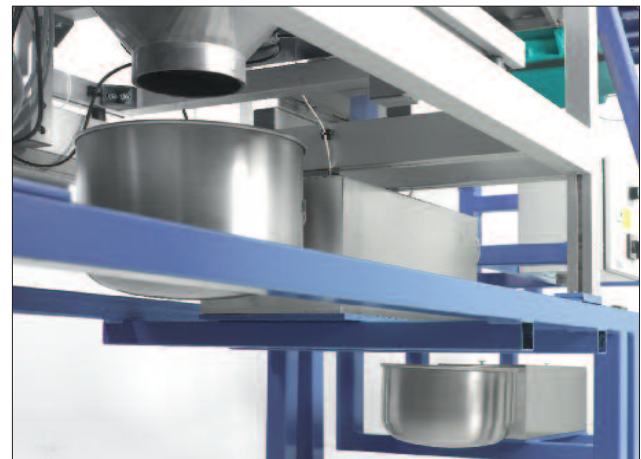
HAVER CPA 4 GRAVIOPT mit zwei Drehbehälterwaagen für den Siebunter- und Siebüberlauf